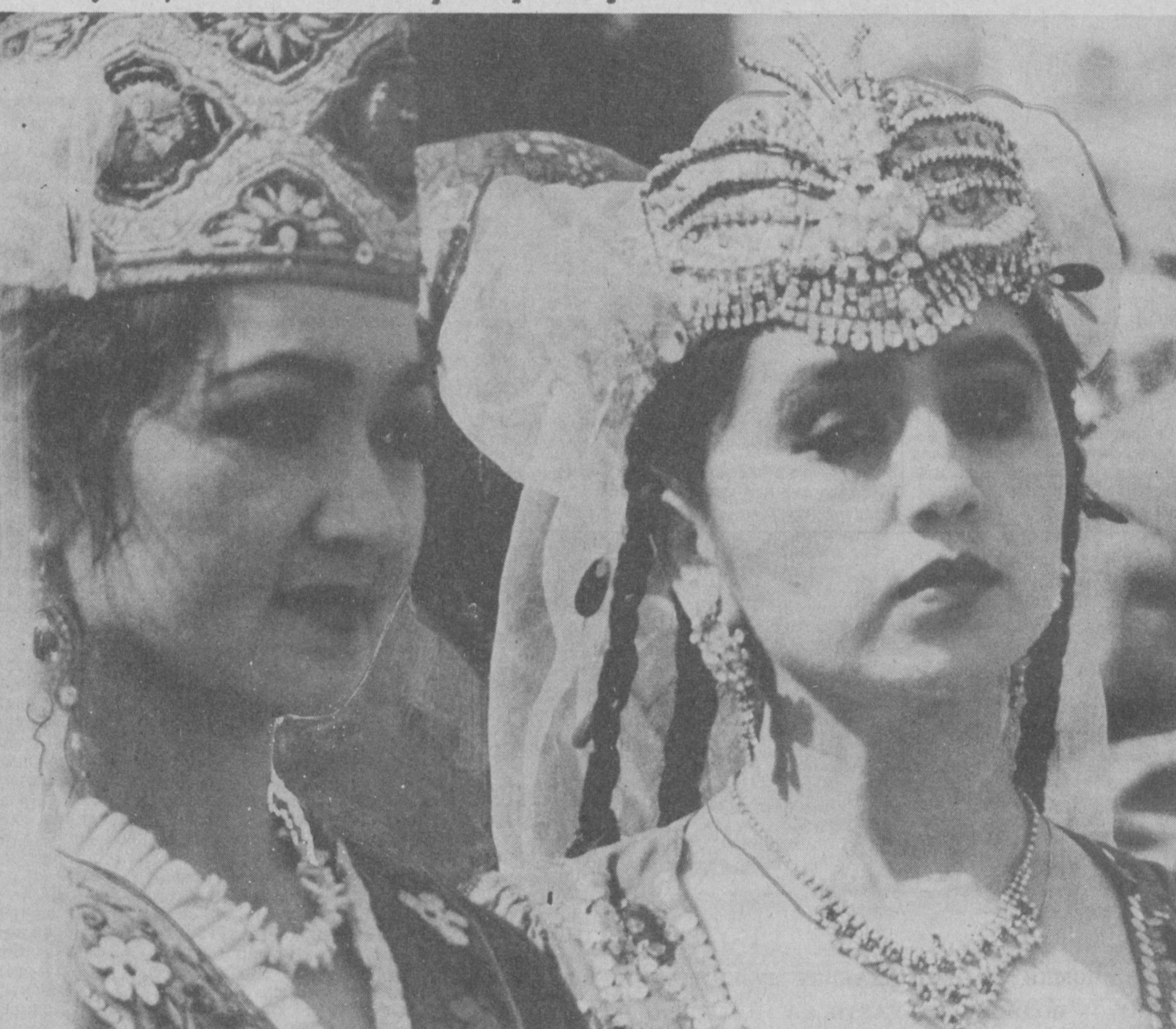
Оққушлар парвозга шай...