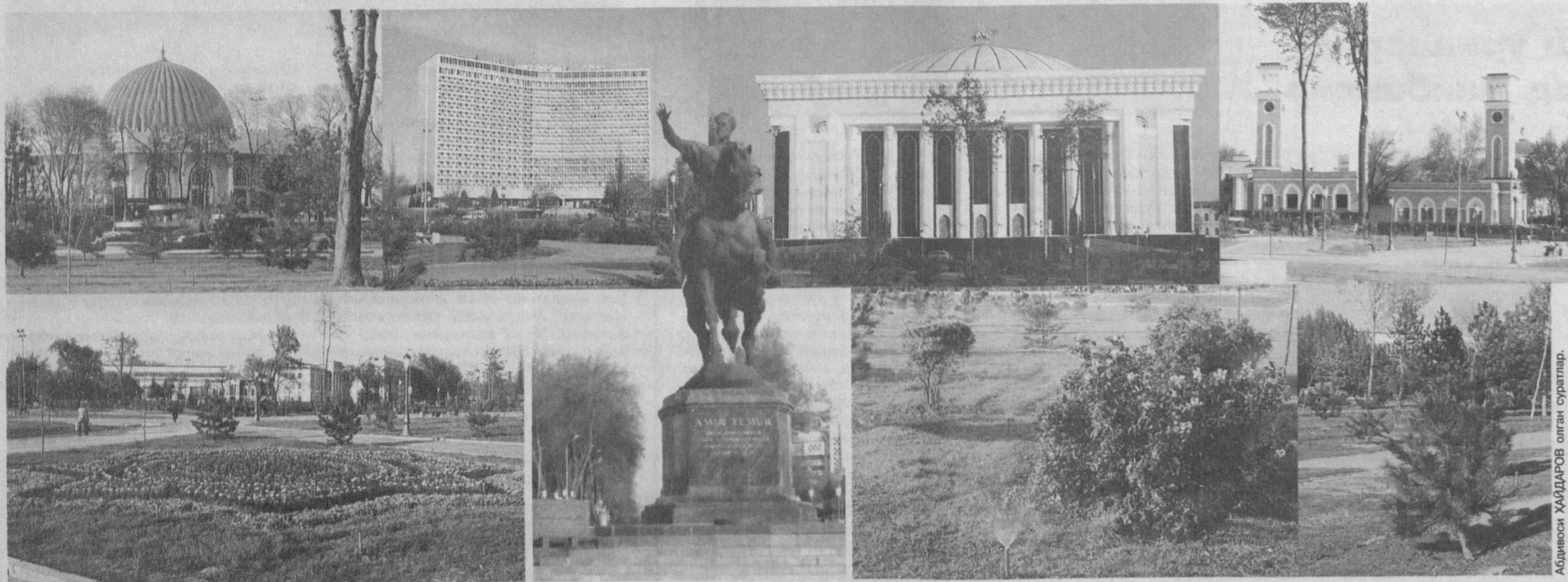
(Давоми. Боши 1-бетда.)

Чунончи, Тошкентнинг қоқ марказидаги Амир Темур хиёбонида амалга оширилган ва бугун ҳам давом этатган улкан ишлар унинг шаклу шамойилини бутунлай ўзгартириб юборди. Бир йил нари турсин, ҳатто, атиги бир ой шахарда бўлмаган киши бугун хиёбонга ташриф буюрса, унинг тароватидан хайратта тушиши табиий. Зеро, қисқа фурсат ичида мазкур майдон кўркам масканга, бетакорор мейморий ёнимдаги яхлит ансамбль кўринишига эга бўлди. Ҳеч иккиланмасдан айтишимиз мумкинки, юртимизнинг ҳар бир фуқароси миллий маънавий қадриятларимизни, мейморчиликимизнинг юксак намуналарини ўзида мужассам этган ушбу замонавий комплекс тимсолида халқимизнинг асрий орзу-умидлари, бунёдкорлик ва яратувчанлик қудратининг яна бир амалий намунасини кўраётган бўлса ажаб эмас. Яқин ўтмишга назар солсак, Амир Темур хиёбони бир асрдан зиёда вақт муболағидан кўп синовларни бошидан кечирганига гувоҳ бўламиз. Милодий VII-VIII асрларда. Чоқ вилоятнинг марказий шаҳарларидан бири бўлган Мингүрик, айниқса, гуллаб-яшнади. Хусусан, савдо-сотиқ, ҳунармандчилик, санъат, мейморчилик тараққий этди. Буюк ипак йўли орқа-