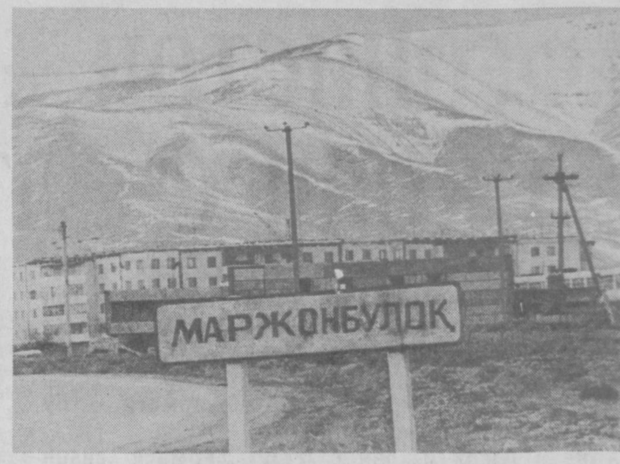
Ҳақиқат Маржонбулоқ шахар ҳоқими тайинланди. Ҳоқим Т. Т. Рабимов қонимиз раҳбарияти билан биргаликда Шароф отанинг назари тушган юртин боғу бўстонга айлантириш учун келгусидаги режаларни келишиб олди.

Мамлакатимиз бозор иқтисодиёти пиллапояларидан ҳадам ташламоқда. Бизнинг Маржонбулоқ олтин қонимиз жамоаси ҳам бундан мустасно эмас.