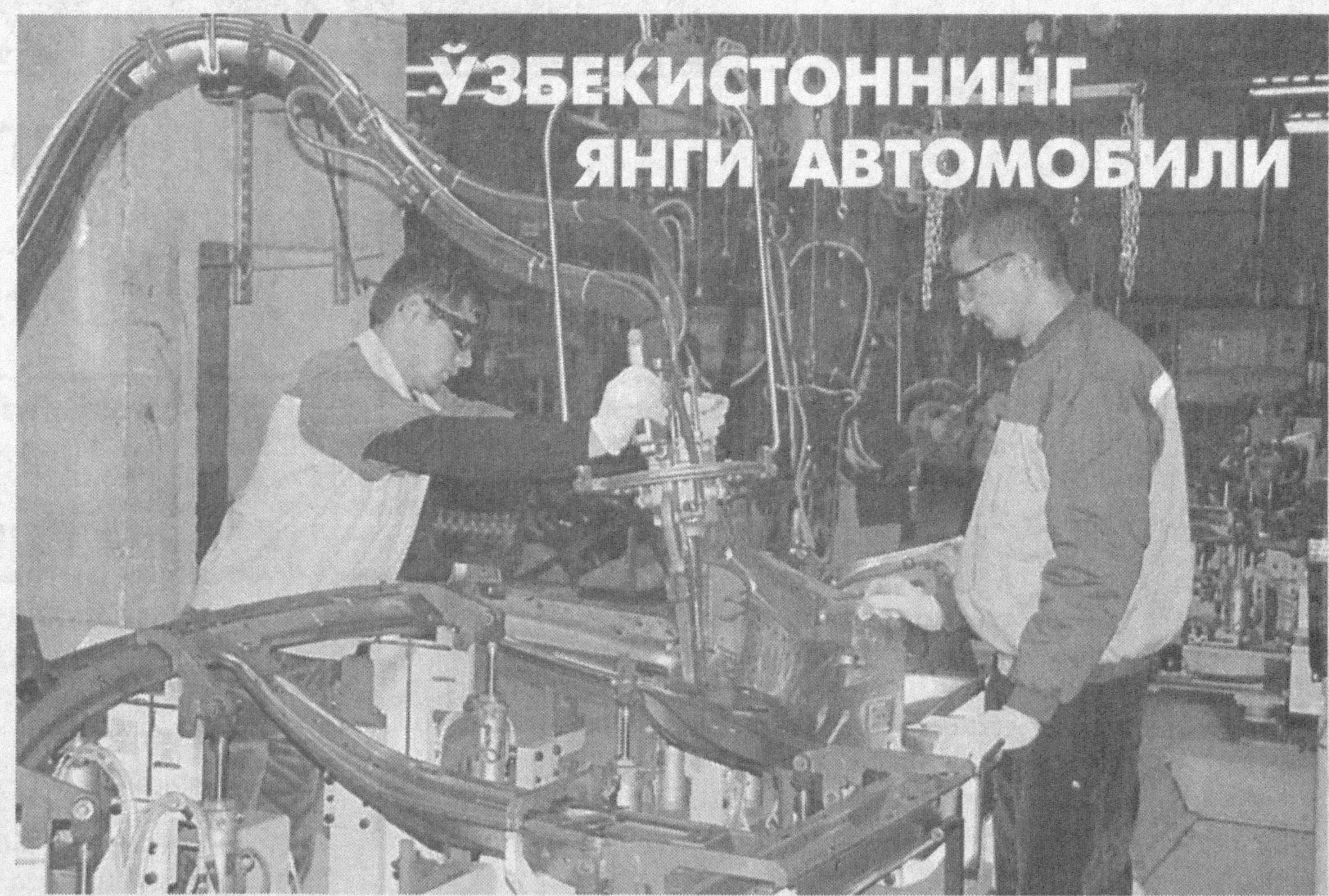
ЎЗБЕКISTONNING ЯНГИ АВТОМОБИЛИ

Анджон вилояти Асака шаҳридаги «GM-Uzbekistan» қўшма корхонасида ишлаб чиқарилаётган автомобильларга мамлакатимиз ташқарисидан ҳам буюртма кўпаймоқда.