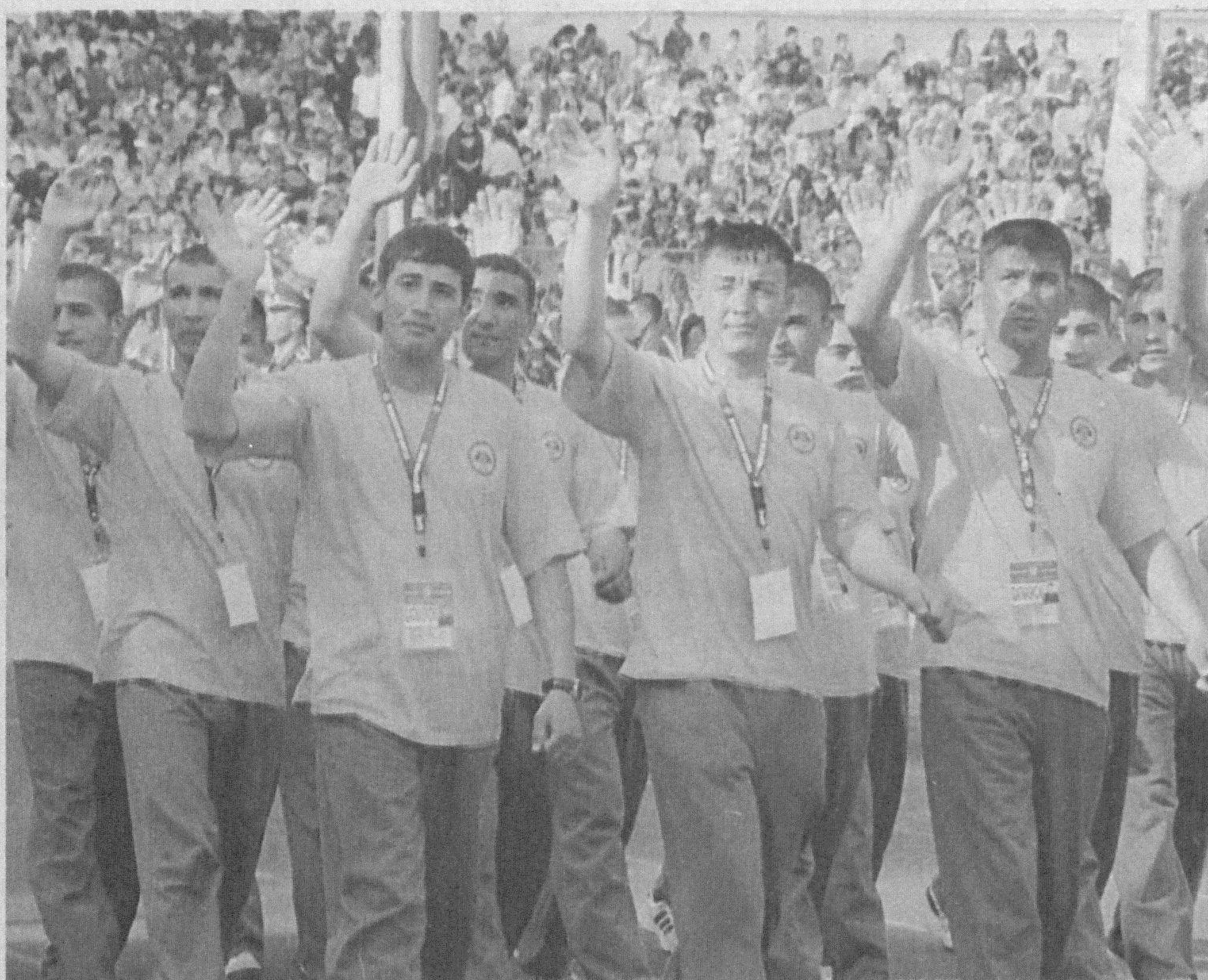
Асқар ЁҚУБОВ (ЎЗА) олган суратлар.

Тошкент ва Чирчиқ шаҳарларида спортнинг ҳарбий-амалий ва Олимпия турлари бўйича тўртинчи «Умумармия ўйинлари» бошланди. 7 майгача давом этадиган ушбу спорт байрамида жамоалар ҳарбий учкураш, офицерлар учкураши, кураш, кўпкураш, енгил атлетика, тош кўтариш, волейбол, сузис, стол тенниси ва бокс бўйича ўзаро куч синашади.