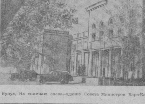
Нукус. На снимках: слева—здание Совета Министров Кара-Калпакской АССР; справа—улица имени Карла Маркса.