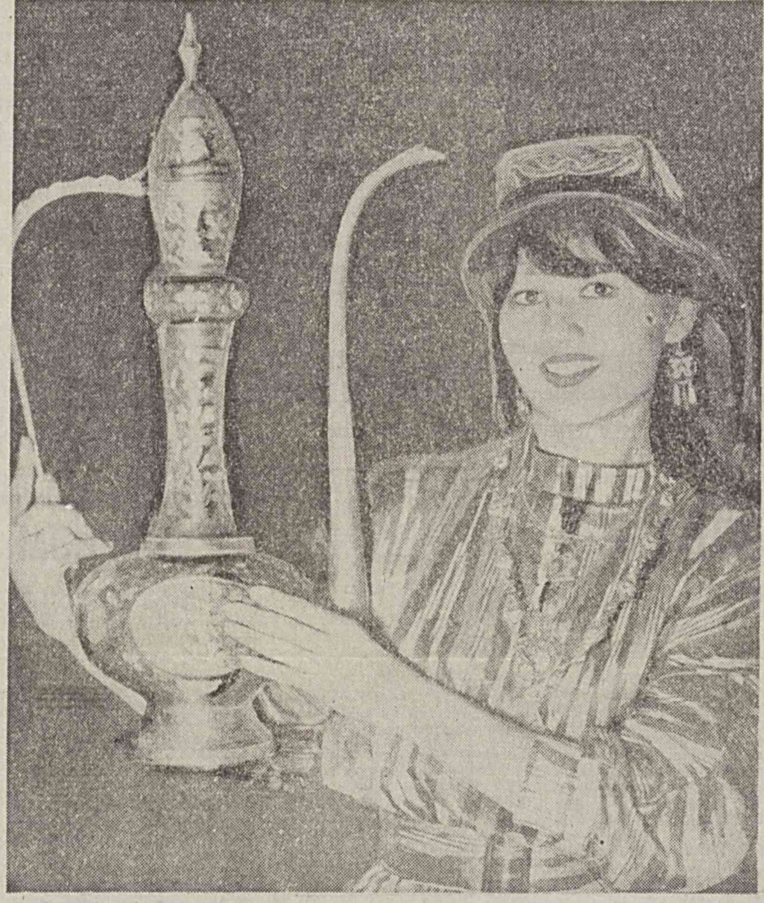
Иўк, англишдингиз, мидлий кийимларни кийиб, хуш кайфиятда сувардан сизга боқиб турган бу ўғал киз нафис, мақшикор офтобани кўз-кўз қилмайти...