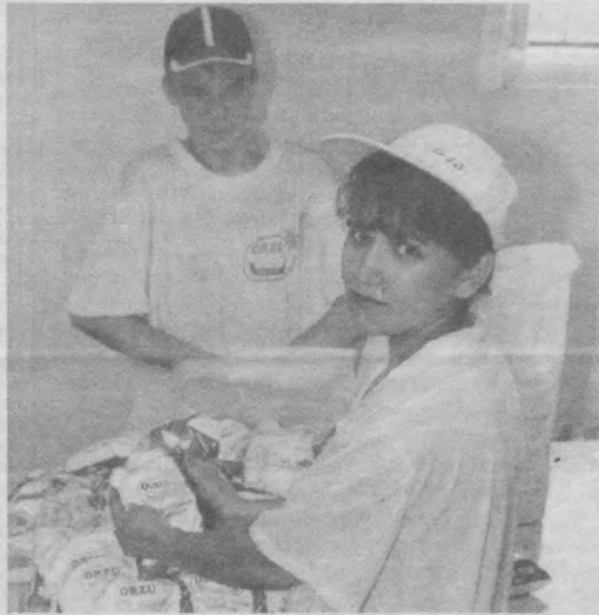
«Орзу-ош тузи» шўба корхонаси жамоаси сифатли маҳсулотлар тайёрлаш ва уларни харидор дидига мос қадоқлашга алоҳида эътибор қаратмоқда.

● ЎЗБЕКИСТОН Банк-молия академиясида Мирзо Улуғбек туман ҳокимлиги ташаббуси билан уюштирилган «Мамлакатимиз ривожига ёш олимларнинг роли» мавзудаги анжуман Мустақиллигимизнинг 11 йиллигига бағишланди.