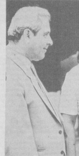
НА СНИМКЕ: на XXVII Ташкентской городской партийной конференции.