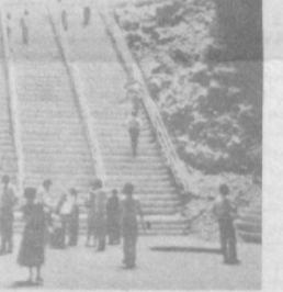
Одним из главных мест паломничества туристов является знаменитая пещера Бату, расположенная в горном массиве в окрестностях Куала-Лумпура...