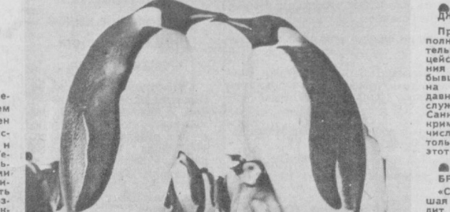
Образцовая семья.

ОТ 24 ДО 30 ОЧКОВ. Вам не удалось наладить хорошие отношения ни с учителями, ни с друзьями вашего сына или дочери. Причиной этого может быть чрезмерная, болезненная привязанность к своему ребенку. Вы живете исключительно для него, в нем заключен единственный смысл вашей жизни. Нельзя сказать, что это благоприятно для правильного воспитания ребенка, для его взаимоотношений с окружающими, для атмосферы в семье. Вам непременно следует изменить стиль поведения и отказаться от целой, в которые вы закопали собственного ребенка. Очень скоро вы убедитесь, как хорошо это отразится на вас самих: высвободится время, и вы сможете уделять больше внимания супругу и самой себе.