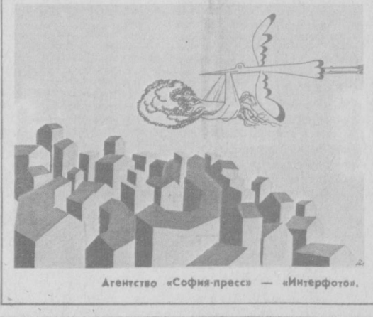
Агентство «София-пресс» — «Интерфото».