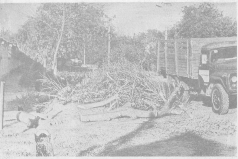
● Когда в инстанциях согласованья нет... ● Стучим, да не в те двери. ● Пообещать — не сделать. ● Управление без управления. ● Пора и власть употребить. ● Без закона не обойтись.