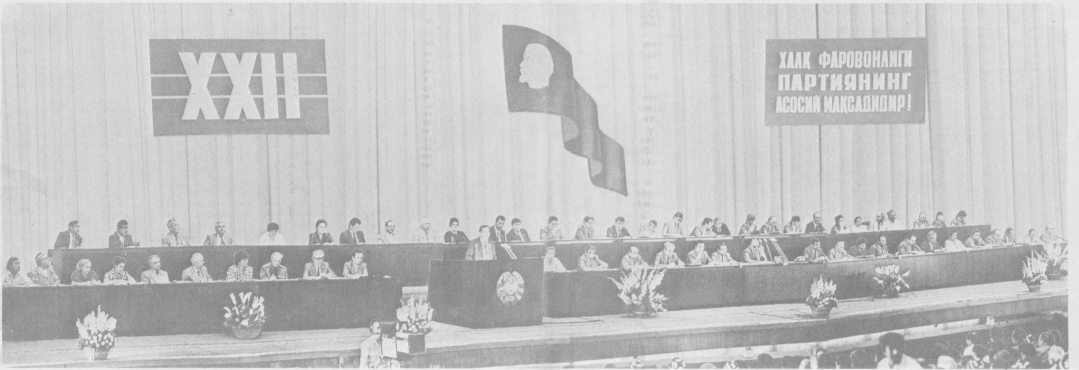
ТАШКЕНТ. Дворец искусств. 4 июня 1990 года. Президиум XXII съезда Коммунистической партии Узбекистана. На трибуне первый секретарь ЦК Компартии Узбекистана, Президент республики И. А. Каримов.

С Политическим докладом ЦК XXII съезду Компартии республики выступил первый секретарь ЦК Компартии Узбекистана, Президент Узбекской ССР И. А. Каримов.