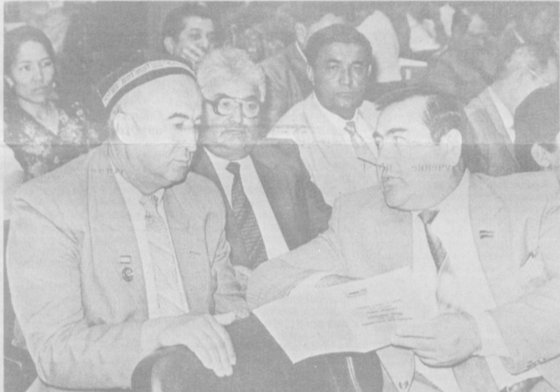
Ташкент, XXII съезд Компартии Узбекистана. На снимках: ● В зале заседаний съезда. ● Интервью Узбекскому телевидению.

Затем съезд перешел к рассмотрению следующего вопроса повестки дня — выборам Центрального Комитета и контрольно-ревизионной комиссии Коммунистической партии Узбекистана. Сегодня съезд продолжил работу.