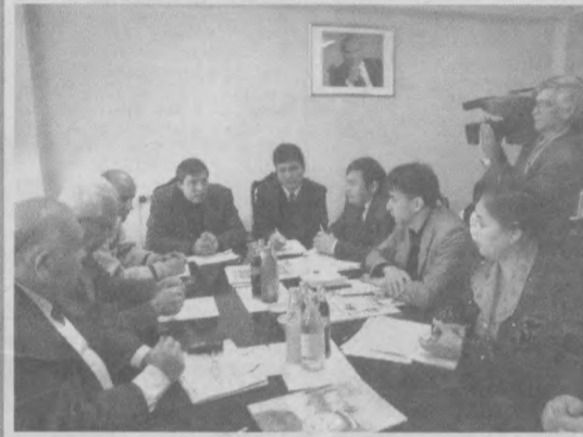
Тошкент шаҳар матбуот ва ахборот ҳудудий бошқармаси, «Тошкент оқшом» ва «Вечерний Ташкент» газеталари, «Тошкент» телеканали, «Пойтахт» радиостудияси ҳамкорлигидаги давра суҳбати

иктирослашмаганлиги яққол сезилиб туради. Шунинг учун журналистларнинг ҳам иқтисодий, ҳам ҳуқуқий билимларини ошириш учун ўқув-лар ташкил этилса фойдалан холи бўлмади. Яна газетанинг иқтисодий ҳаётда сарлава жуда катта роль ўйнайди. Газетонини жалб қиладиган сарлаванинг аҳамияти каттадир.