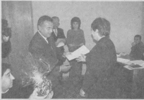
«Кизилтепагеология» давлат геологик корхонасининг саноатий типидида болалар соғломлаштириш оромгоҳи республика кўрик-танловда қатнашиш ҳуқуқини қўлга киритди. Бир гуруҳ фаол ходимлар шаҳар Кенгашининг ташакурномаси ва эсдалик совғалари билан тақдирландилар.