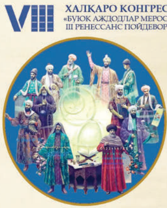
23-26 avgust 2024 yili TOBRIK - SAMARQAND