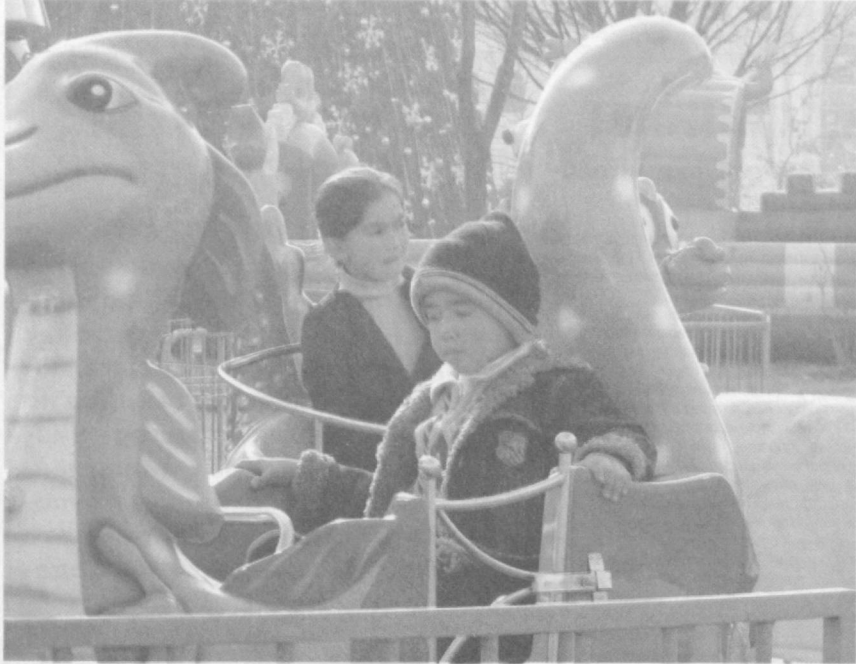
Счастливые моменты детства.