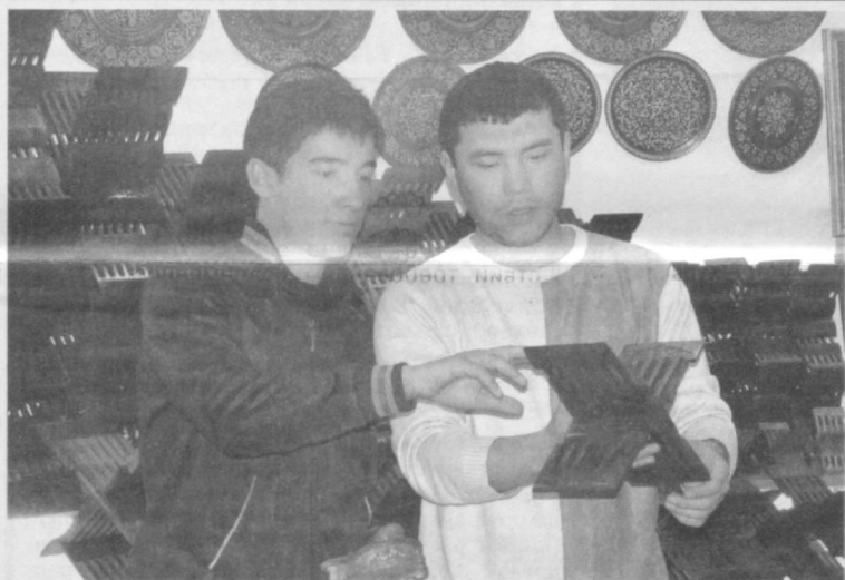
Лаух – подставка для книг.