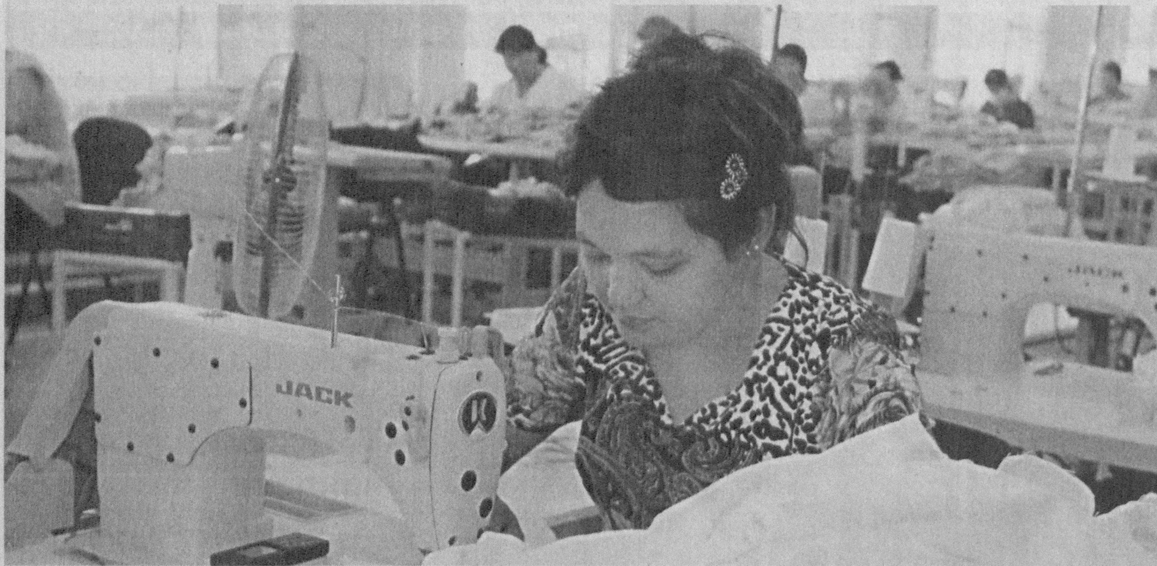
(Давами. Боши 1-бетда.)