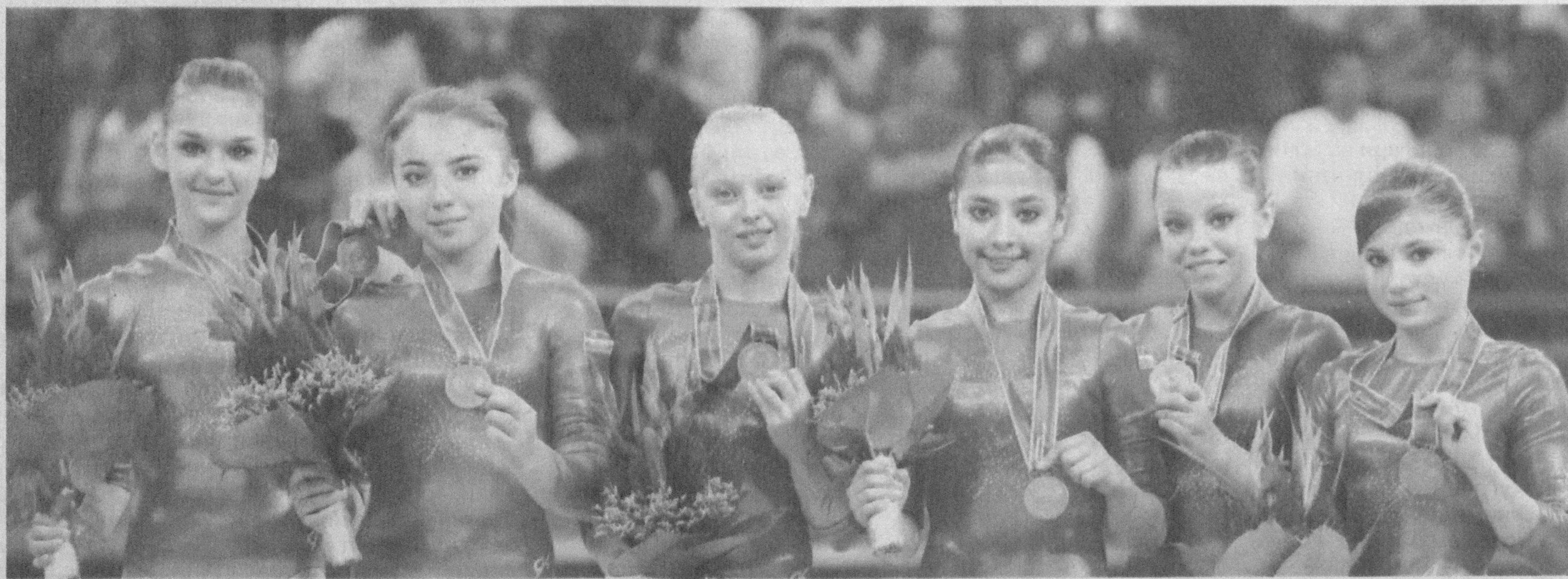
Спорт гимнастикаси бўйича мамлакатимиз терма жамоаси қизлари

Иккинчи кунги беллашувларда ҳам дзюдочиларимиз голибона юришларини давом эттиришди. Беллашувларда Шокри-