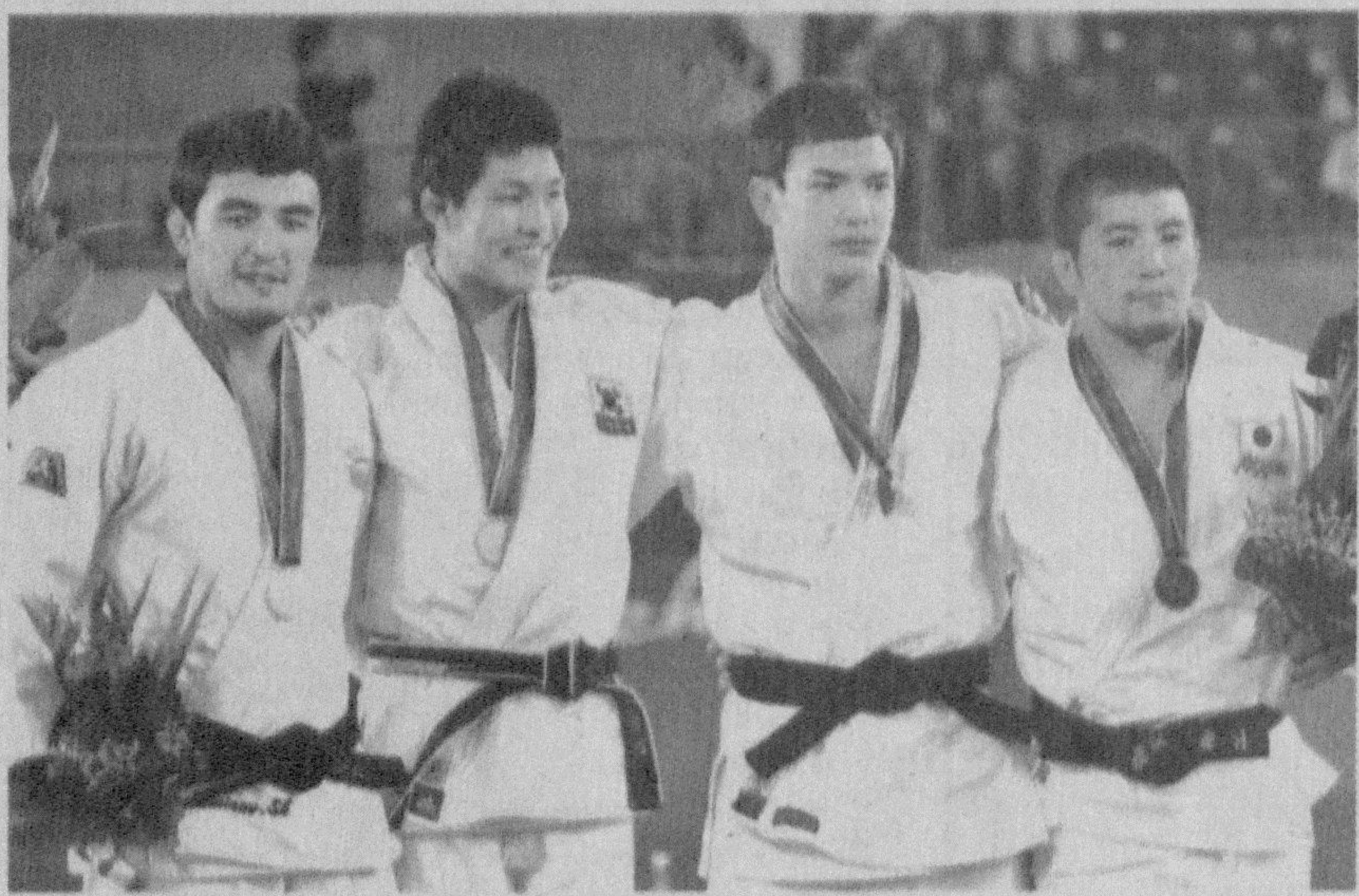
Олтин медал учун дзюдочиларимизга бироз омад етишмади.

Эркин ХОЛБОБОВ, «Ўзбекистон овози» мухбири.