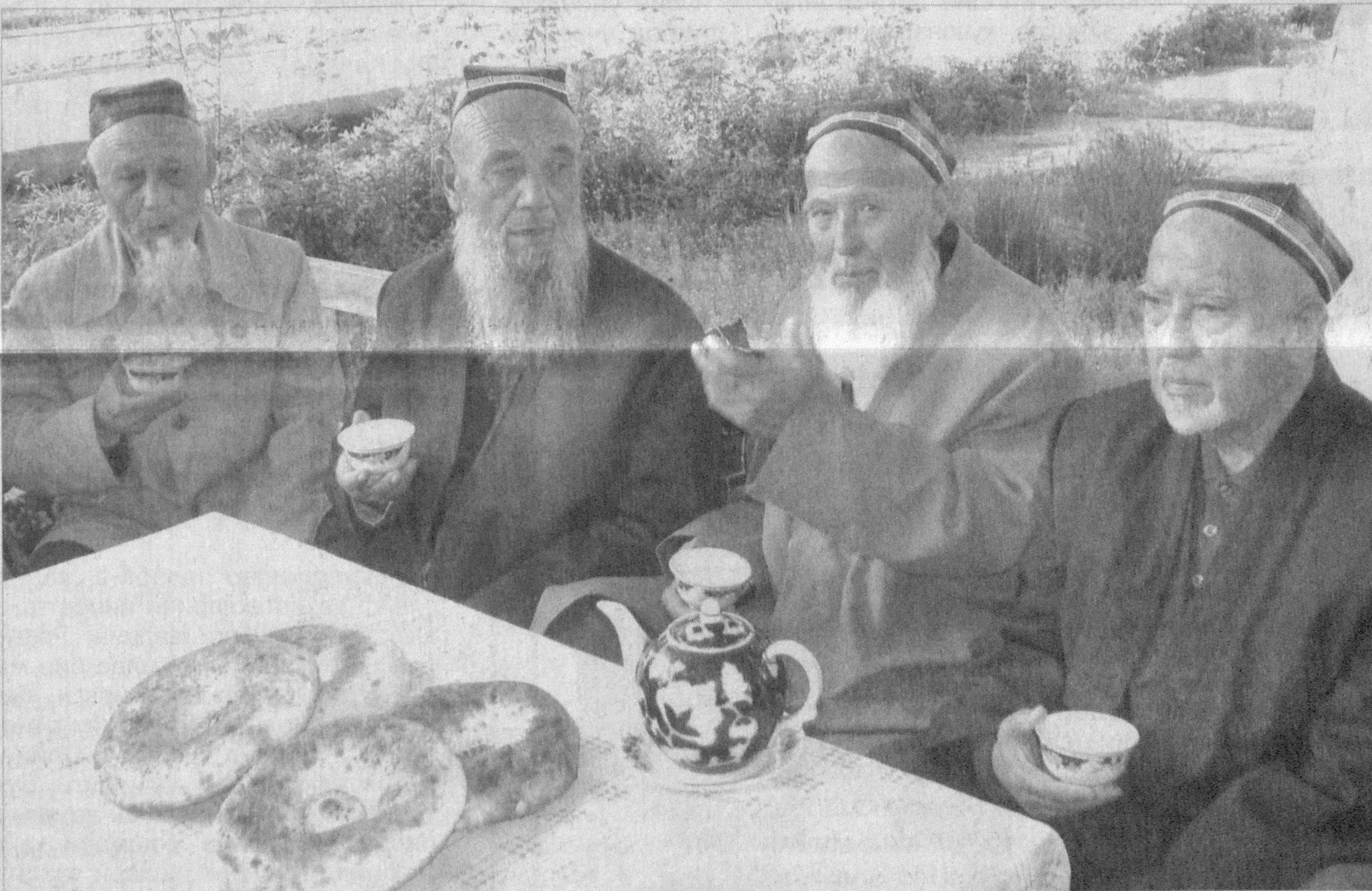
Эркакларнинг умр кўриши аёлларникига нисбатан кўпроқ бўлади.