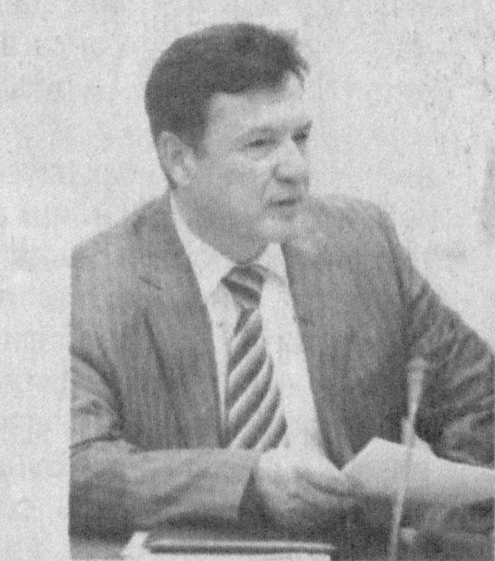
Нурдинжон ИСМОИЛОВ, Олий Мажлис Қонунчилик палатасининг Қонунчилик ва суд-ҳуқуқ масалалари қўмитаси раиси, Ўзбекистон ХДП фракцияси аъзоси.

■ Ўзбекистон ўзи танлаган мустақил тараққиёт йўлидан дадил илдамлаб бормоқда. Кўзлаган олий мақсадлари- мизга эришиш учун ислохотлар босқичма-босқич амалга оширилаётгани ўзининг юксак самарасини берапти.