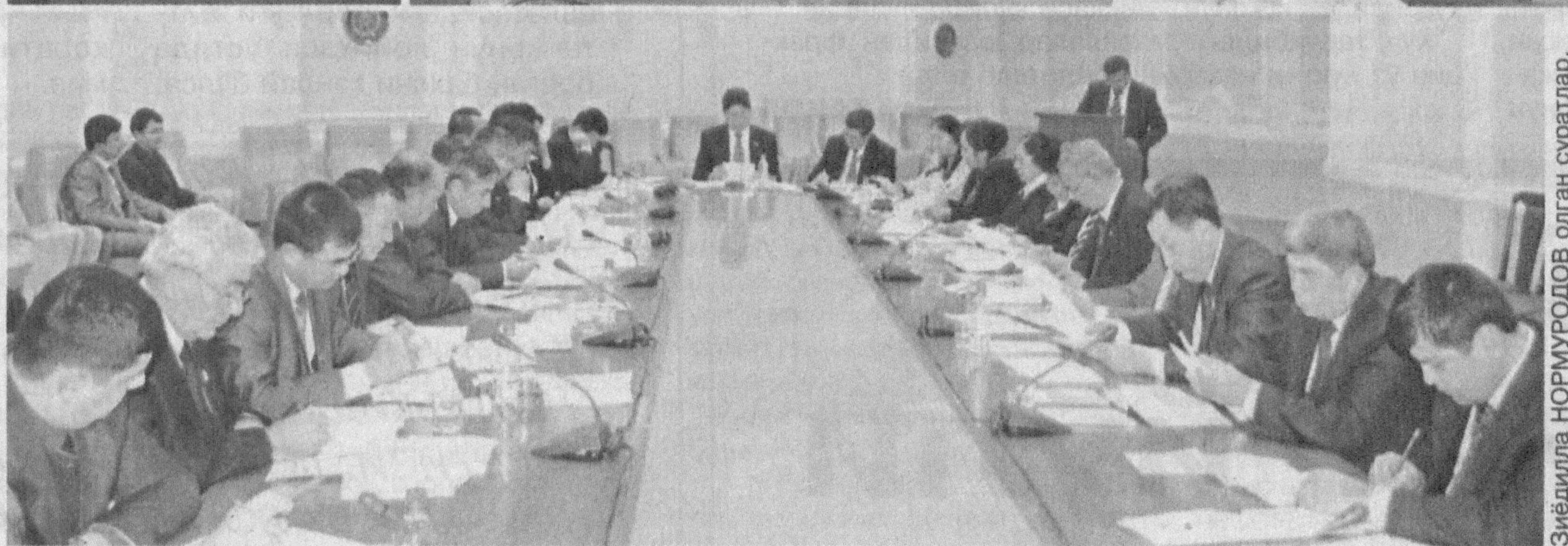
Экспертиза НОРМУРОДОВ олган суратлар.