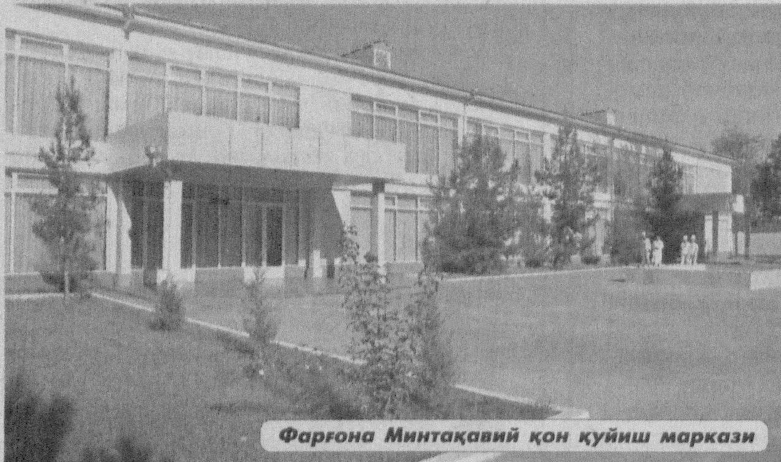
Фарғона Минтақавий қон қуйиш маркази