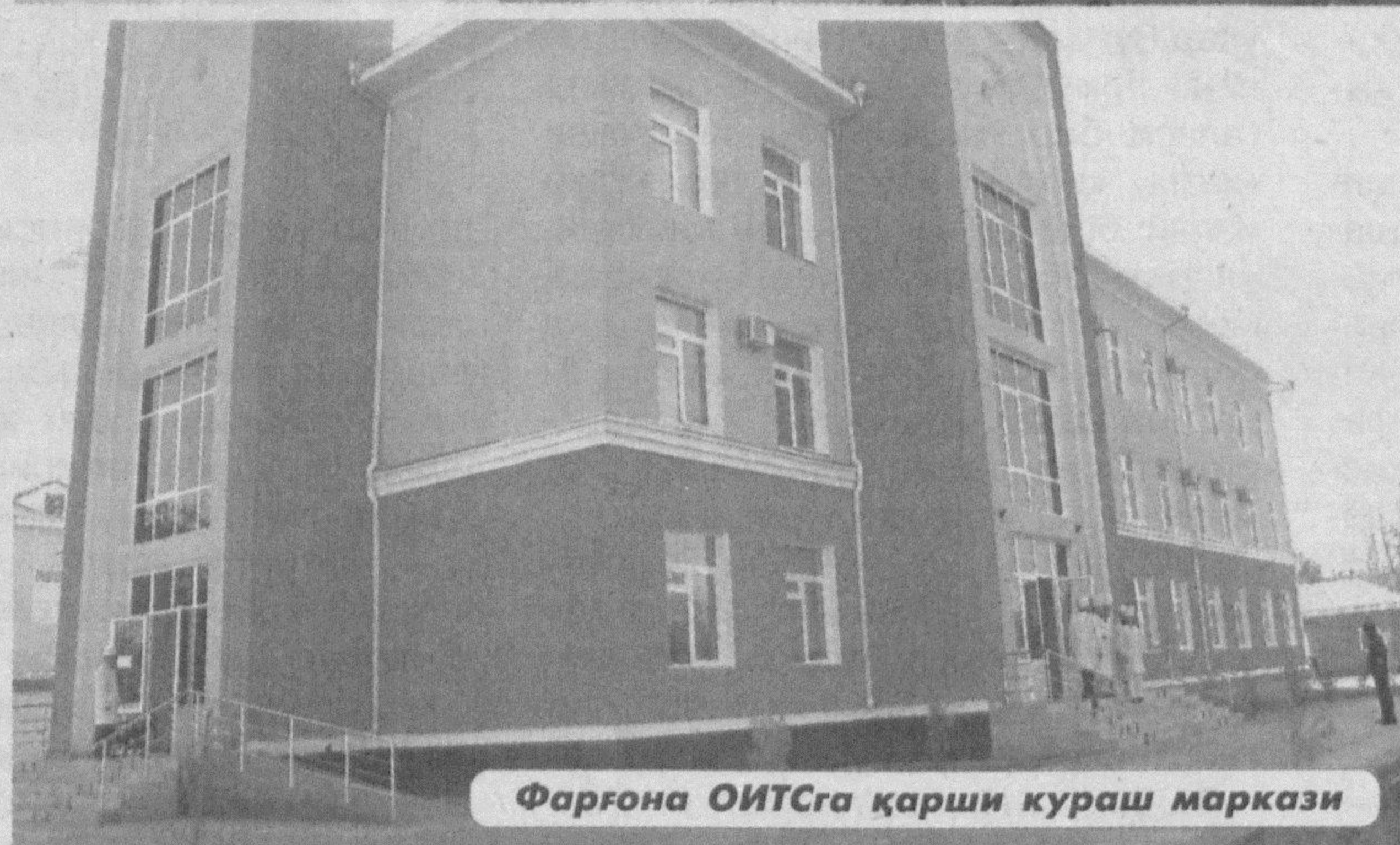
Фарғона ОИТСга қарши кураш маркази