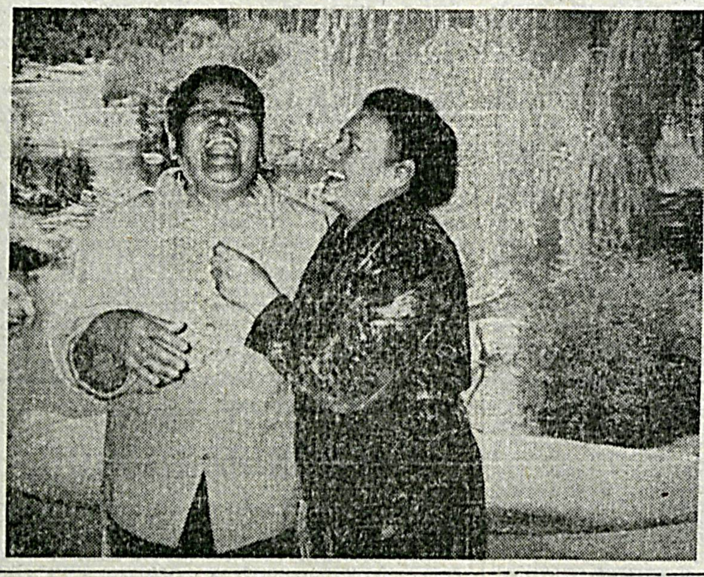
Нурга тўғри хандаси бор хондон, Куллу билан чаргомонлар бу жаҳон.