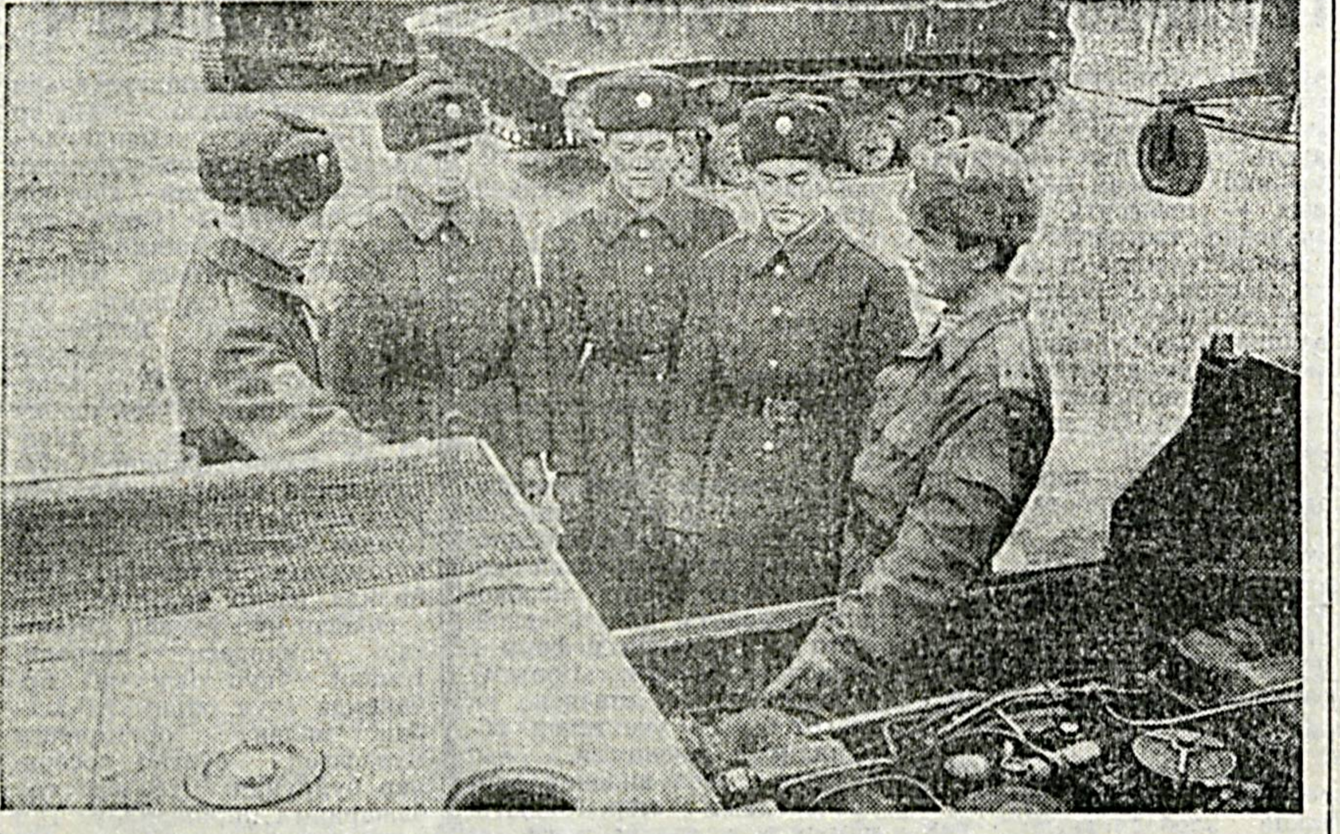
Механик-ҳайдовчи посбонлар йотуғининг асосий қисми жанговар техниканинг «қалқисид» эканлигини яхши билишди.