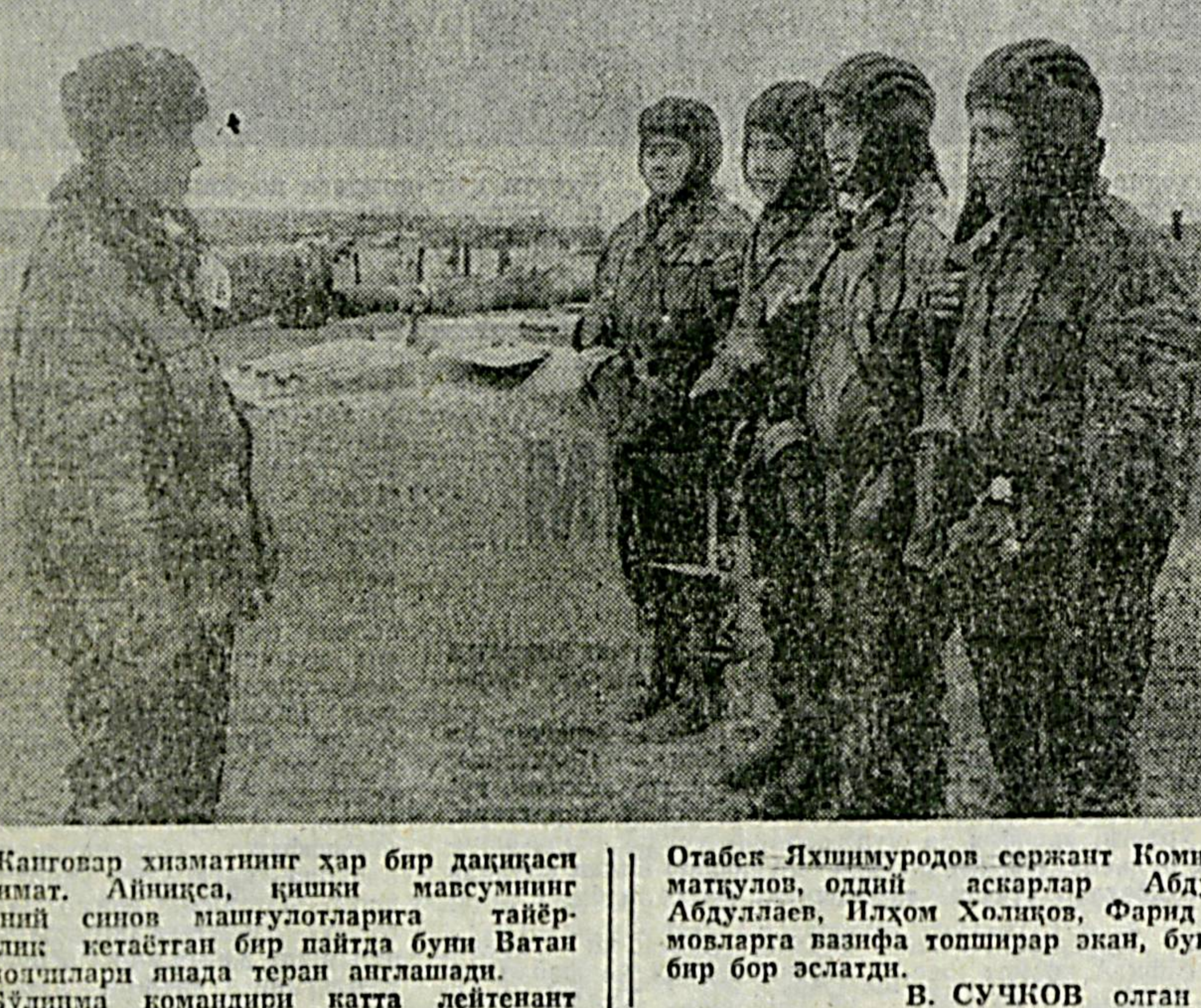
Жанговар хизматининг ҳар бир дақиқаси ганимат. Алғисча, қисми масъулнинг яқини синов машғулотларига тайёргарлик келтириш...