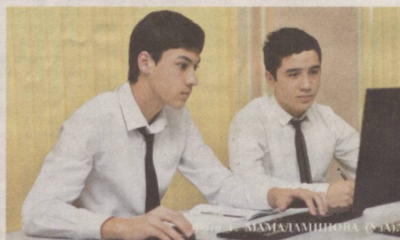
IT незаменимы в обучении.

Так, по каждому направлению подготовки кадров будет разработана отдельная концепция, предусмотрено установить национальные квалификационные рамки и профессиональные стандарты. Их смысл заключается в определении минимальных навыков и квалификации, требуемых от работника, и формировании на этой основе модульных учебных планов. Учебный процесс будет постоянно совершенствоваться, чтобы профессиональное образование превратилось в необходимый компонент развития экономики. Так будет достигнута подготовка высококвалифицированных работников, специалистов среднего звена.