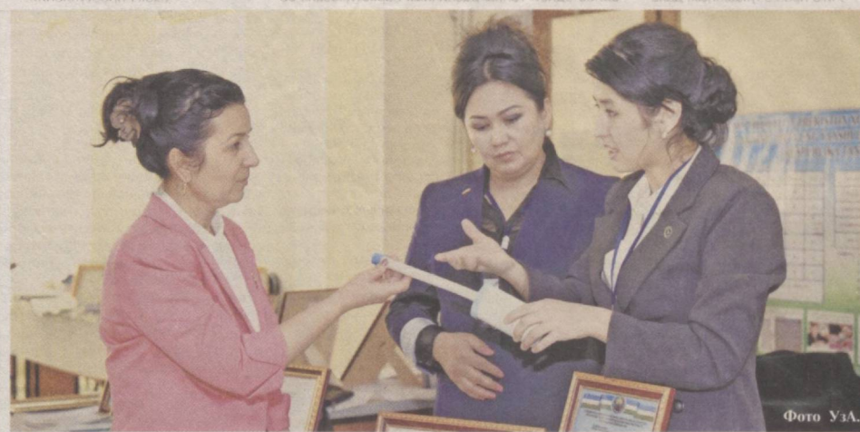
С каждым годом женщины все активнее осваивают сферу бизнеса.