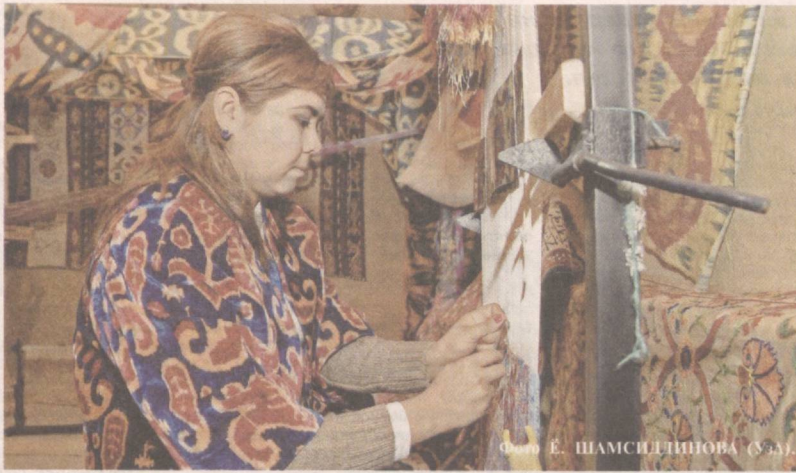
Красота узбекских тканей ручной работы покорила весь мир.