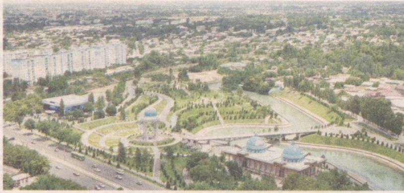
Новые дороги – гордость современного Ташкента.