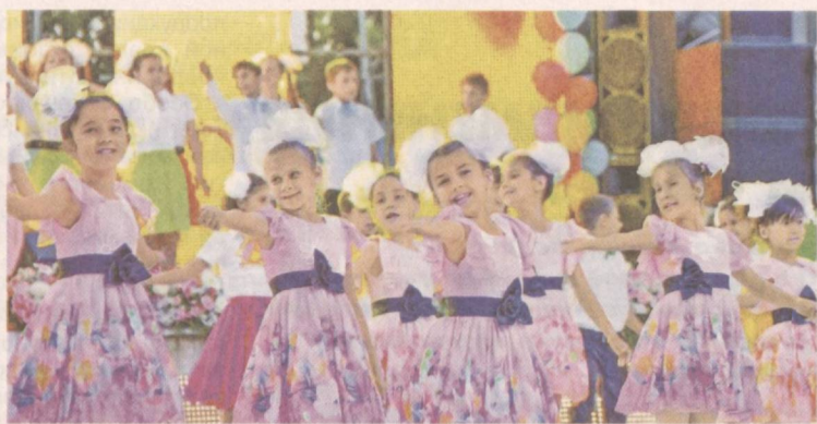
Счастливые моменты детства.