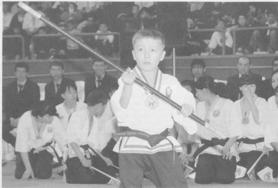
Воля к победе укрепляется на соревнованиях.