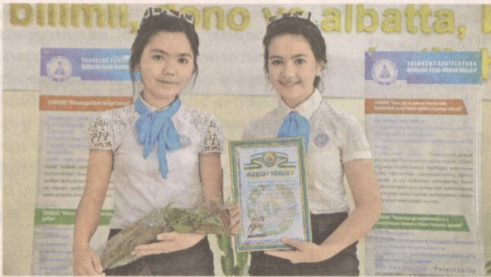
В нашей стране созданы все условия для гармоничного развития молодежи.