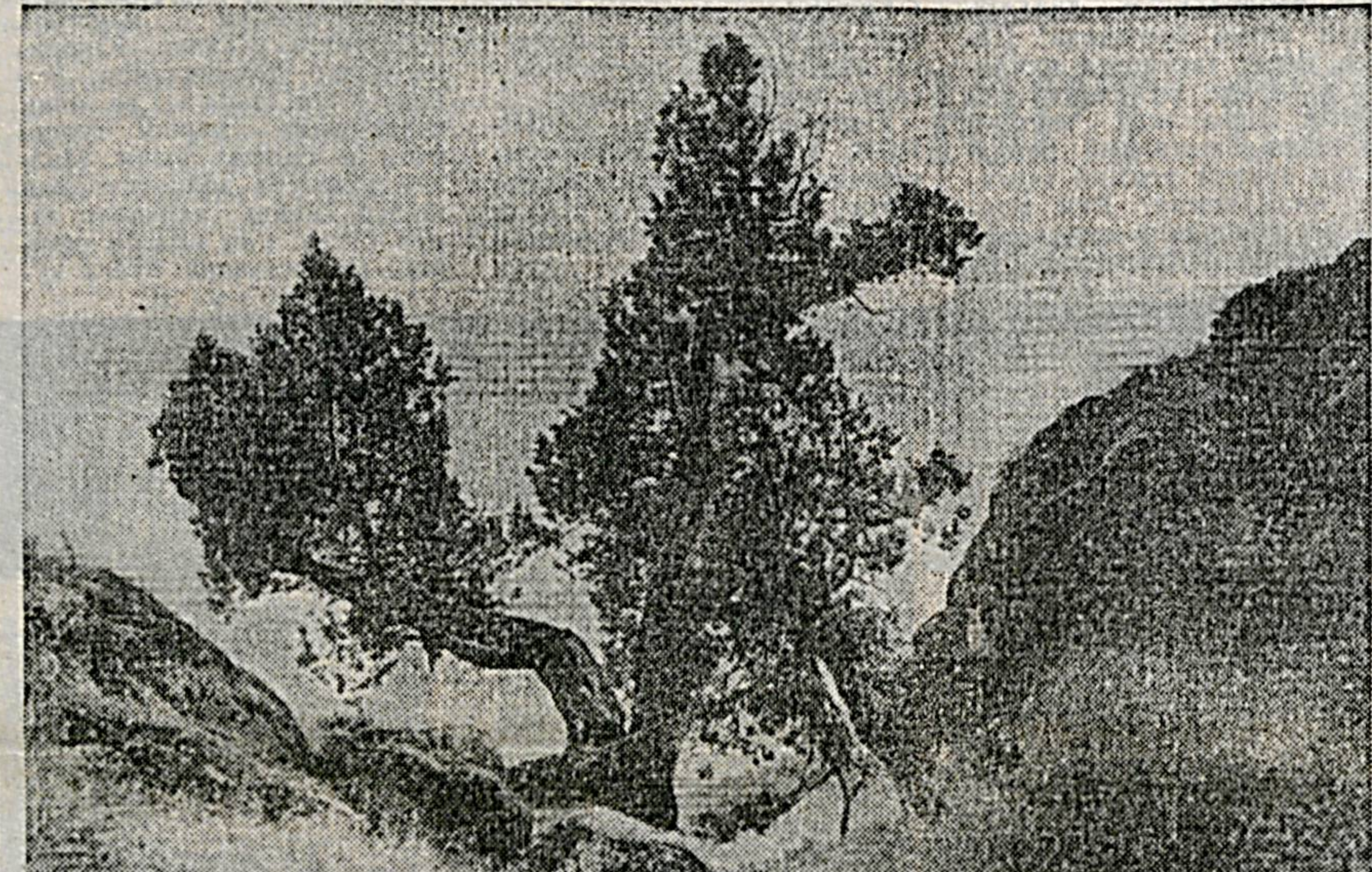
Песна в Узбекистане полностью вступила в свои права. Даже в высоких горах зазеленели деревья...