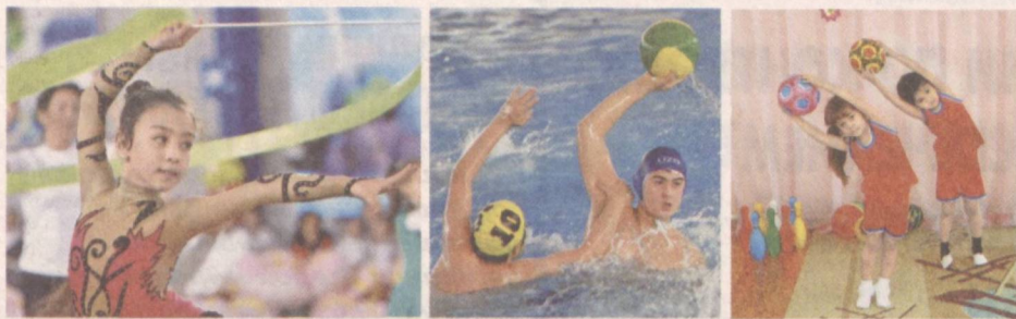
Занятия спортом укрепляют организм.