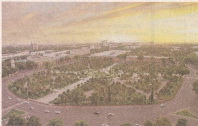
Столица с высоты птичьего полета.