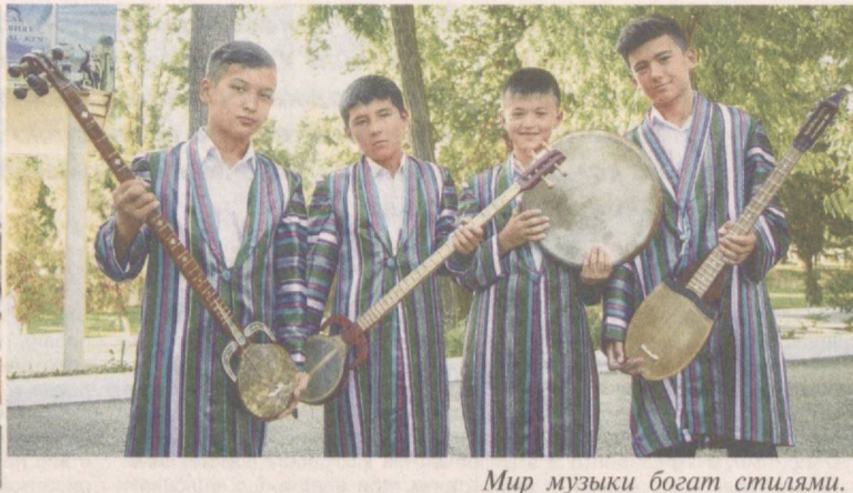
Мир музыки богат стилями.