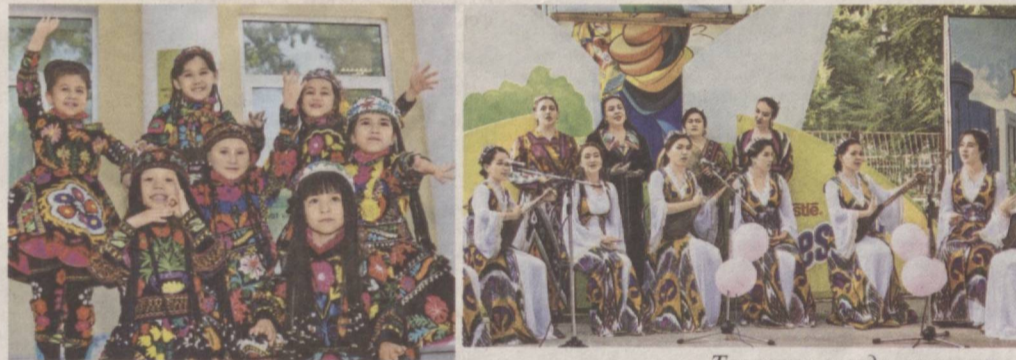
Таланты всегда волнуют.

В нашей стране уделяется особое внимание формированию физически здорового и творчески мыслящего молодого поколения.