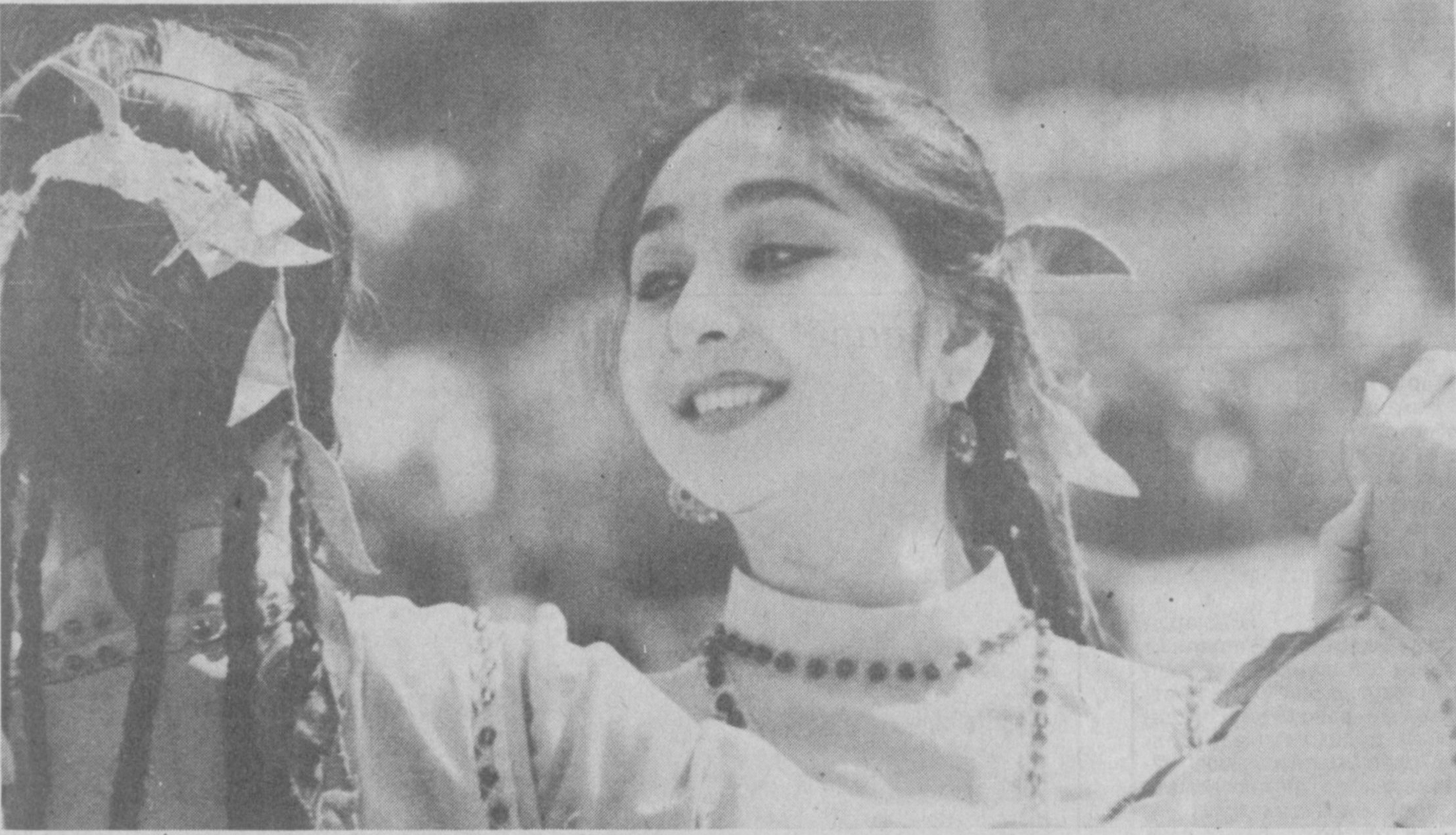
Раққосани сахна чорламоқда.