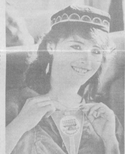
Активного и разнообразного отдыха. Впечатлений у ребят масса. Будет что рассказать на своих дружеских встречах и различных сувениры, самым дорогим из которых для них стал подарок — ташкентских школьников — расшитый шелком тюбетейки.

Сейчас дети Украины находятся в психонате «Чиназа», где созданы все условия для