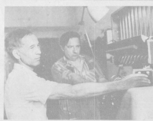
Перестройка: практика, проблемы

Существенный момент. Известно, что в обострении межнациональных отношений, помимо других причин, немалую роль сыграли территориальные претензии одной республики к другой.