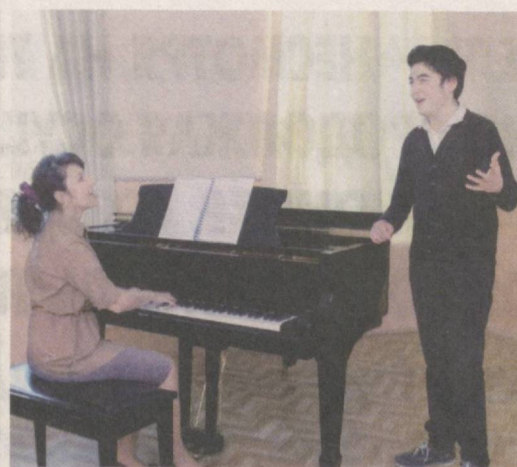
В стране подрастает талантливая и любознательная молодежь.