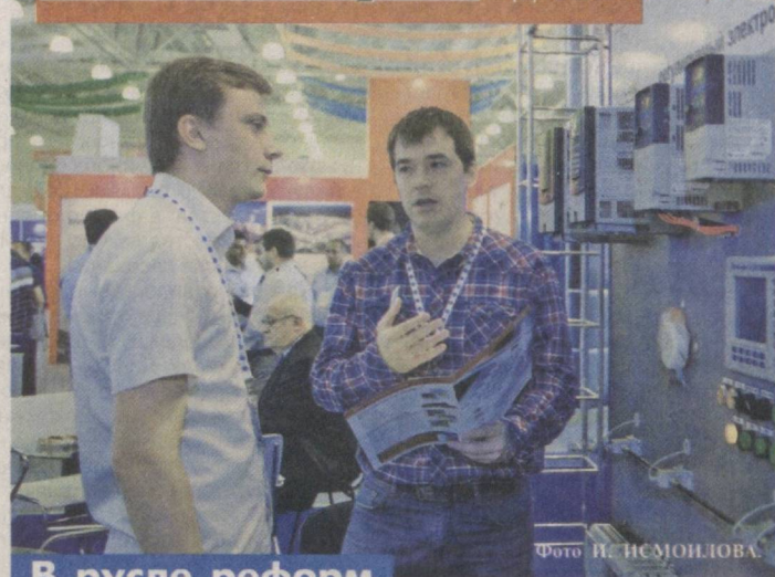
В русле реформ