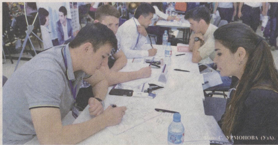
В столице прошла IX специализированная ярмарка вакансий «JobFair 2016». Организаторами выступили деловая сеть MyJob.uz и газета «Карьера+». В ярмарке участвовало более 70 фирм и компаний, предложивших соискателям свыше 500 вакансий.

● На поддержку занятых предпринимательством женщин за год было выделено 1 трлн. 225 млрд. 35 млн. сумов банковских кредитов.