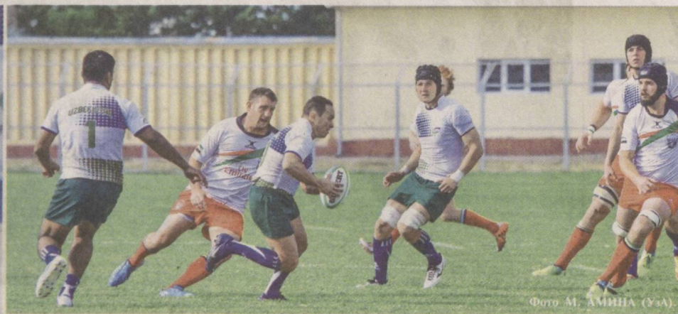
Наши спортсмены на авторитетных соревнованиях завоевывают призовые места.

В Ташкенте прошел чемпионат Узбекистана по легкой атлетике среди юношей и девушек 1999-2000 годов рождения.