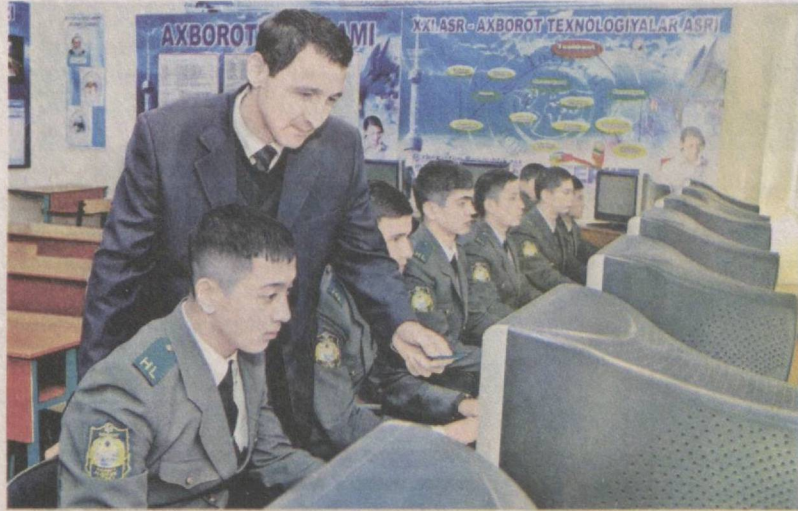
Курсанты стремятся к знаниям.