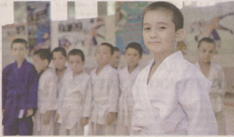
Выбирая здоровый образ жизни.