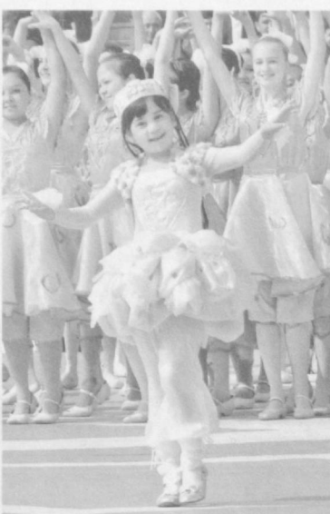
О чем шепчет Навруз...