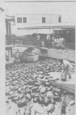
Малайзия. Полеван в Ташкенте.

Оба послания — времен Александра Невского — раскрывают наш представления о жизни людей той эпохи. Кроме янтаря, найдены свинцовые печати, несколько янтарных крестиков, предметы домашнего обихода. Археологам предстоит исследовать еще около четырех метров напластований. Несомненно, такой мощный культурный слой даст новые сведения о прошлом Великого Новгорода. Специалисты полагают, что здесь хранится около двадцати тысяч берестяных грамот. Эта уникальная библиотека еще ждет своих читателей и исследователей.