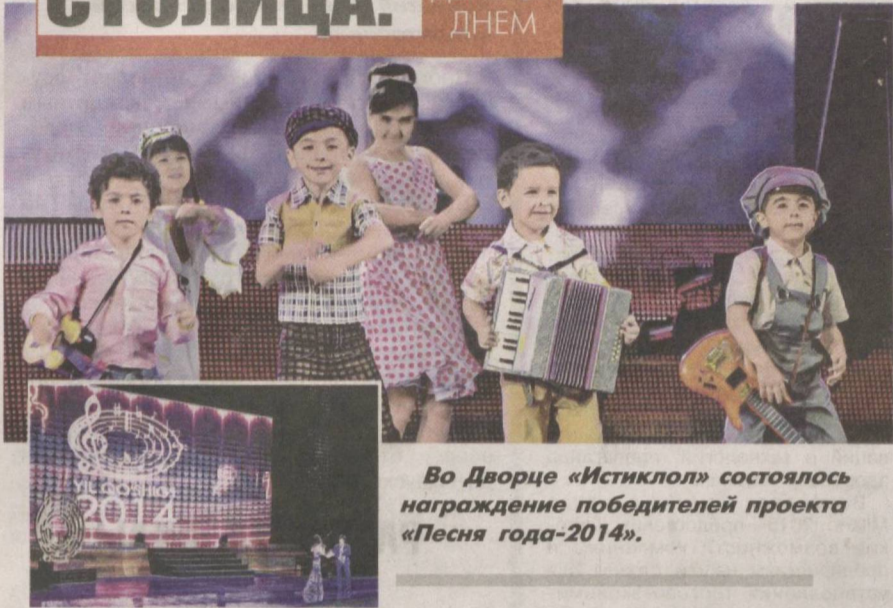
Во Дворце «Истиклол» состоялось награждение победителей проекта «Песня года-2014».