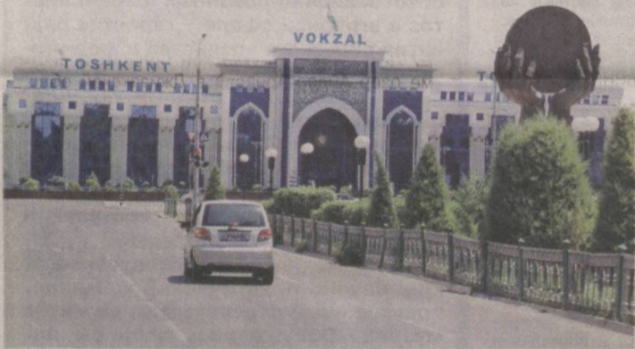
Обновленный вокзал.

ГАЖК «Узбекистон темир йуллари» подвела итоги работы в 2014 году и приняла планы на текущий год.