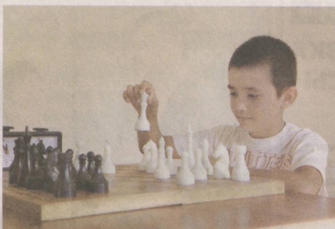
Здоровое поколение — сила страны.