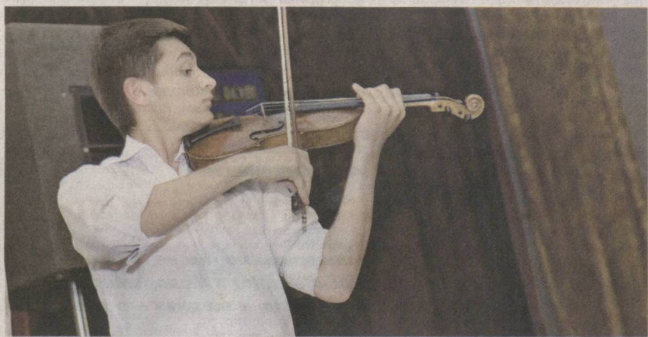
Музыка развивает чувство прекрасного, обогащает духовно.