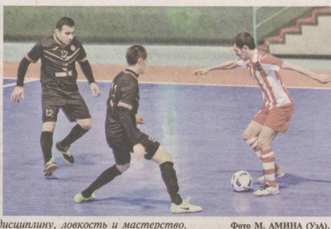
Различные виды спорта формируют дисциплину, ловкость и мастерство.