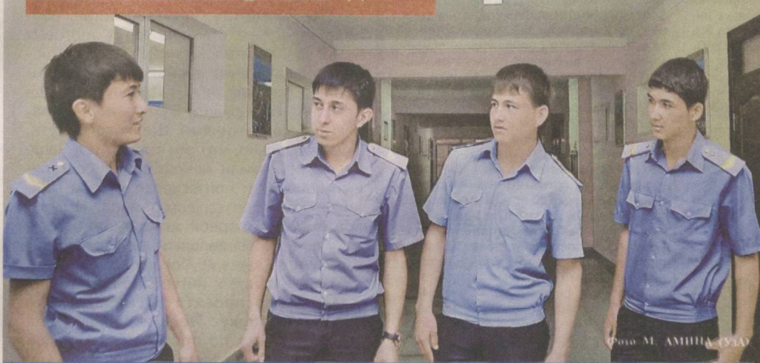
Государственная молодежная политика – в действии