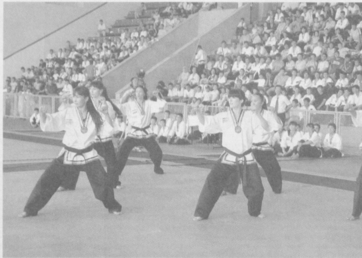
Большой успех в спорте приходит к тем, кто начинает им заниматься с детства.