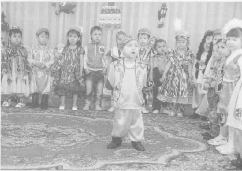
Умеют выразить свои способности и в песне, и в танце наши дети благодаря неустанному труду воспитательниц ДОУ.