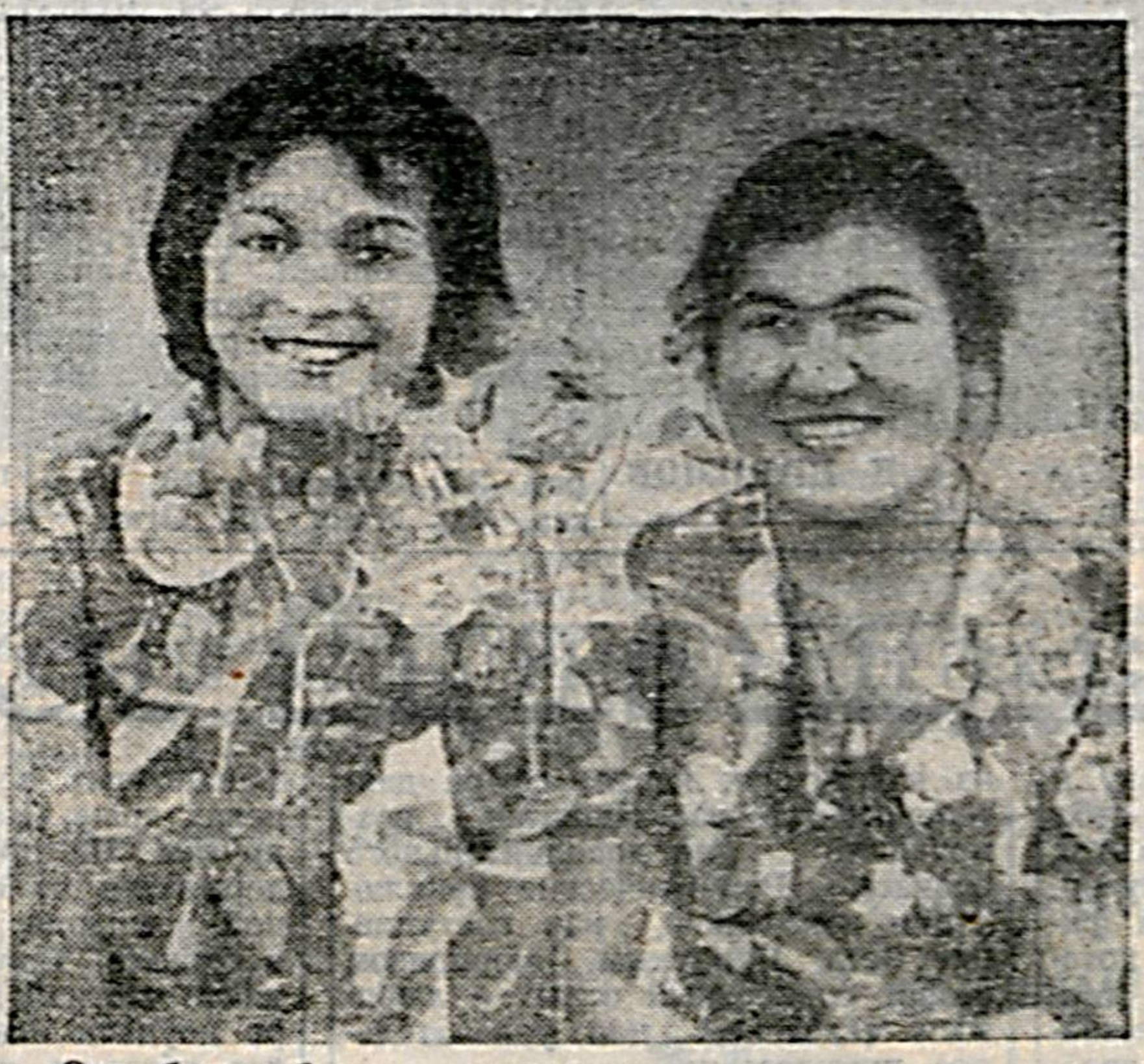
Она билан бола — гул билан лола.