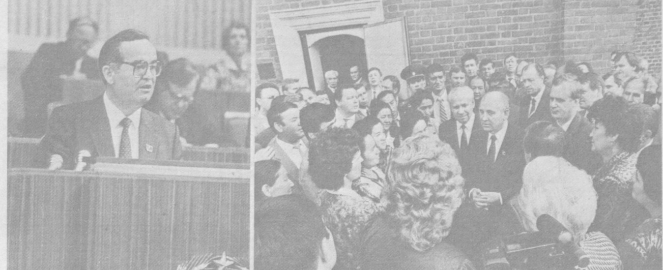
НА СНИМКАХ: выступает первый секретарь ЦК Компартии Узбекистана И. А. Каримов; М. С. Горбачев среди делегатов из Узбекистана.

Выработанные делегатами рекомендации и предложения будут рассмотрены на пленарном заседании съезда.