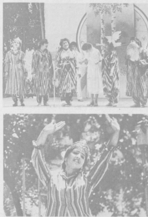
Артисты фольклорного ансамбля «Хуррият» выступают.