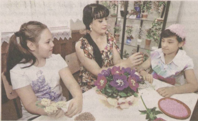
Досуг проводят с пользой.