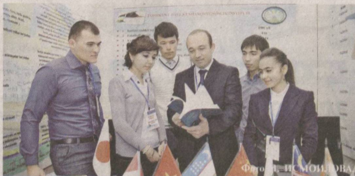
Молодые специалисты пополняют багаж знаний.

— Ежегодно на нашем факультете завершают свое четырехго-