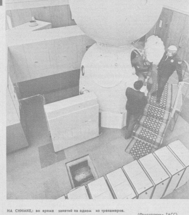
НА СНИМКЕ: во время занятий на одном из тренажеров.

Давно. В ходе реализации уникальной программы было получено свыше 80 видов новых материалов, которые дадут качественный толчок развитию машиностроения. Огромное значение для пассажирской и транспортной авиации приобретает испытанная во время первого полета «Буран» система автоматической посадки.