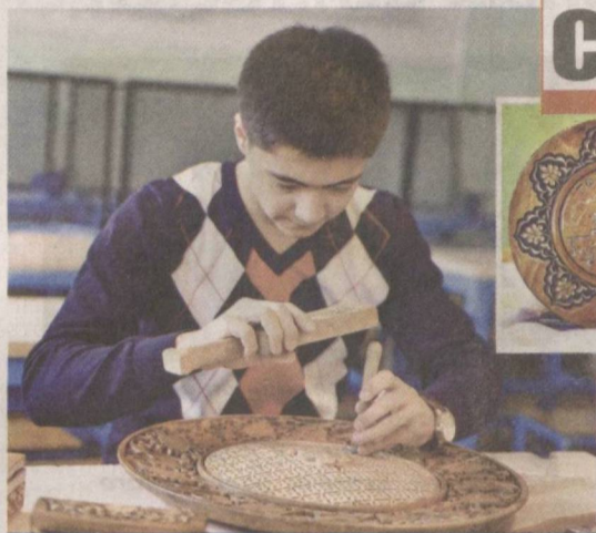
Возрождая народные ремесла

ВЧЕРА в Чиланзарском и Шайхантаурском районах состоялись семинары-тренинги, посвященные дальнейшему повышению правовых знаний членов участковых избирательных комиссий и вопросам эффективной организации работы участковых избирательных комиссий.