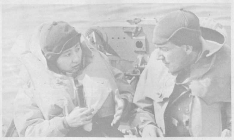
В Центре подготовки космонавтов им. Ю. А. Гагарина идет подготовка японских и английских космонавтов к совместным с советскими космонавтами полетам.